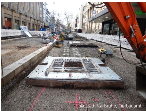
Abbildung 5: Neues Baumquartier nahe der Lammstraße