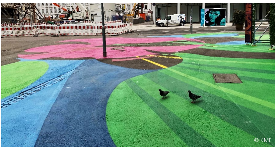
Abbildung 9: Bodenbemalung in der Lammstraße

Dem Frühlingsmotto entsprechend realisieren KME und Marktplatz Carré derzeit außerdem gemeinsam mit dem Team „Combo“ und der Mobilien Jugendarbeit Karlsruhe eine temporäre künstlerische Bodenbemalung in der Lamm- und der Kaiserstraße, bevor diese ab August beziehungsweise ab November 2024 zur Baustelle werden. Das Design wurde vom Team „Combo“ entworfen und ist inspiriert durch die Karlsruher Tulpenbücher.