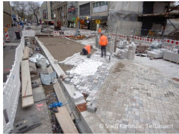
Abbildung 8: Herstellung des Zierbands in der Kaiserstraße mit Schablone