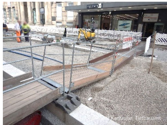
Abbildung 4: Fußgängerführung im Baufeld