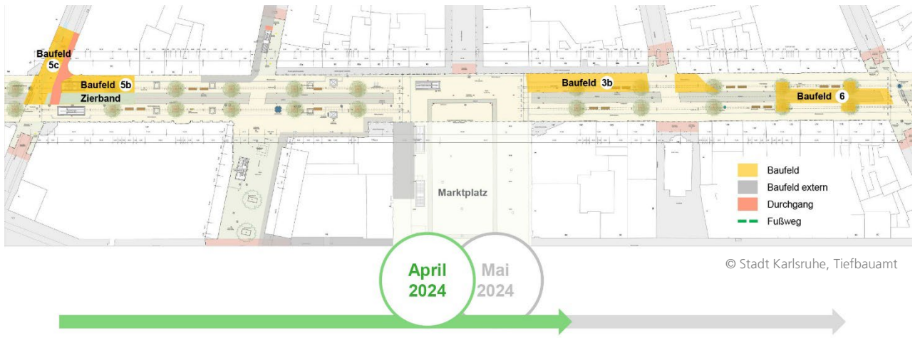
Abbildung 2: Baufelder April bis Mai 2024