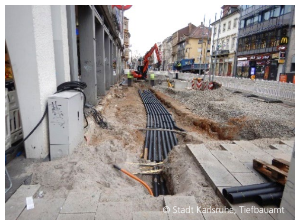
Abbildung 6: Leitungsbau