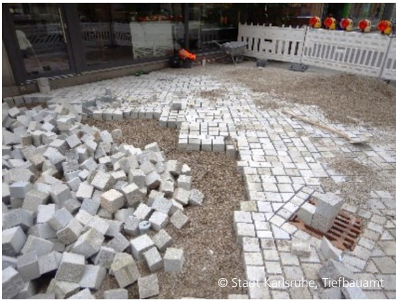
Abbildung 7: Pflasterverlegung im Passeverband in der Kreuzstraße